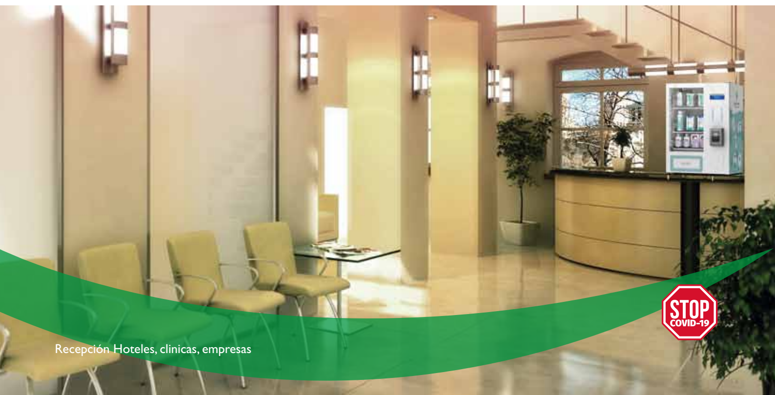
Recepción Hoteles, clínicas, empresas