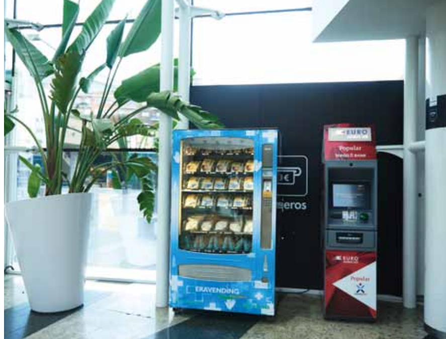
Aeropuertos, estaciones de autobus, tren, ...